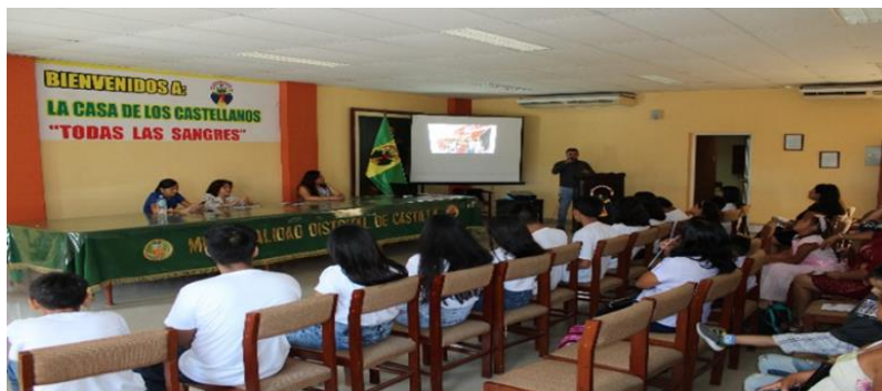
Figura 2. Sensibilización de la problemática con actores locales