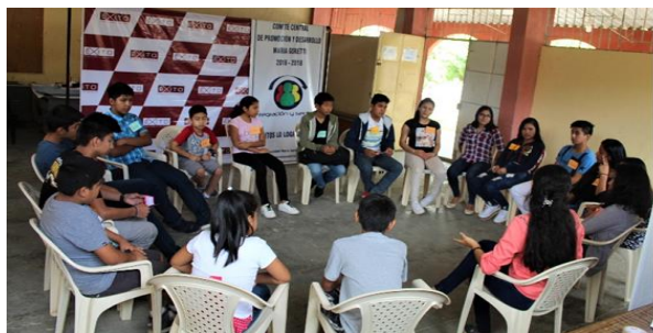
Figura 5. Registro fotográfico de los talleres.

Se presenta imágenes que reflejan las diferentes etapas del proyecto, desde la planificación inicial hasta la ejecución y los resultados obtenidos, cada fotografía captura el esfuerzo, la colaboración y el impacto generado, este recorrido visual muestra el compromiso del equipo y la importancia de cada paso en la consecución de nuestros objetivos.