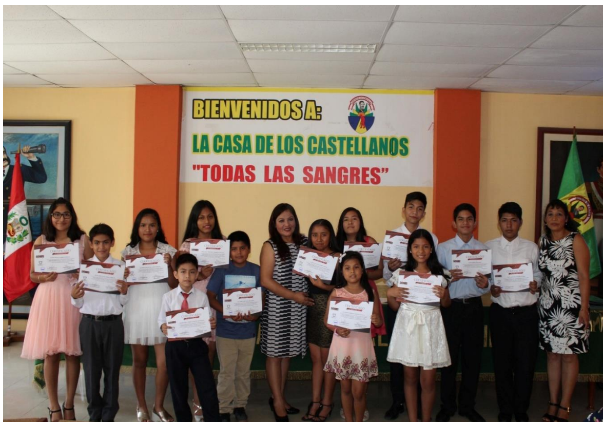
Figura 3. Certificación a los jóvenes participantes del proyecto