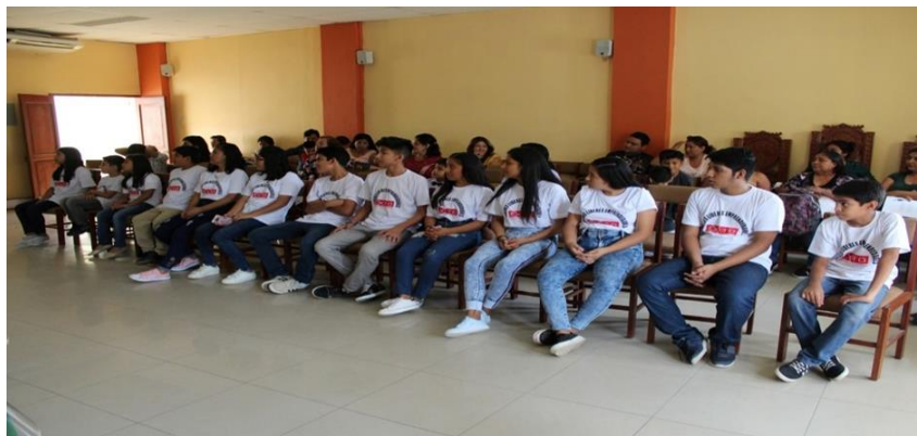
Figura 1. Asistentes del taller “Jóvenes Líderes Emprendedores de Éxito”